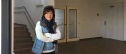
Sportcomplex De Lijster p. 2