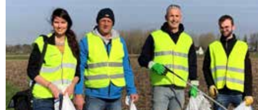
Zwerfvuilactie p. 3